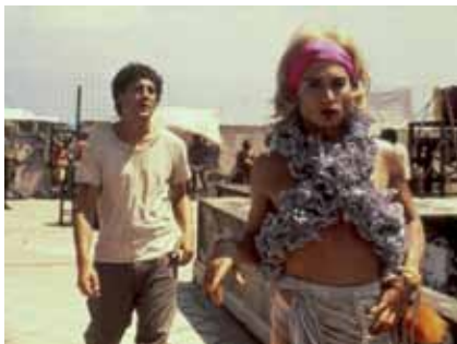
Julian Schnabel, Before Night Falls , 2000

Programminfos auf www.buechereien.wien.at oder unter +43 699 12871500