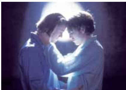
Derek Jarman, Edward II , 1991