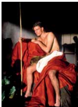
Derek Jarman, Caravaggio , 1986