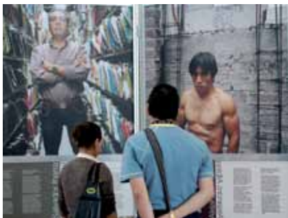
Photoausstellung im Global Village, AIDS 2008 Mexico/Photographic Exhibition in Global Village, AIDS 2008 Mexico