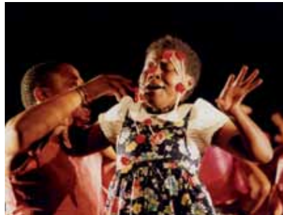
Robyn Orlin, We Must Eat Our Suckers with the Wrappers On , 2006

Pre-sale online from 17 May on www.impulstanz.com