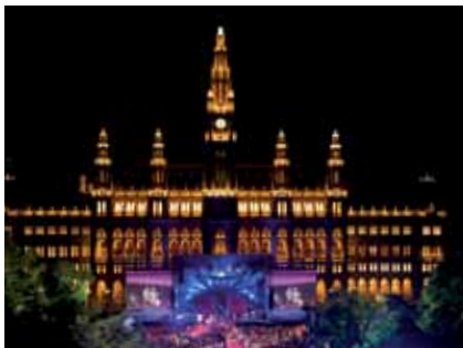
Life Ball, Rathausplatz Wien/Life Ball, Rathausplatz, Vienna

Nähere Informationen zu den Veranstaltungen und Dresscode erfahren Sie unter www.lifeball.org