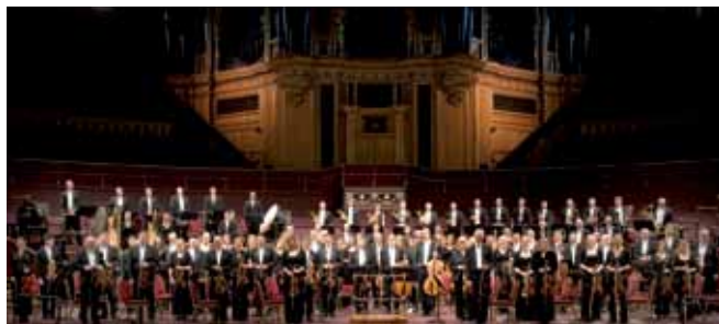
Royal Philharmonic Orchestra, London

Lothringerstraße 20, 1030 Wien Kartenvorverkauf: www.konzerthaus.at