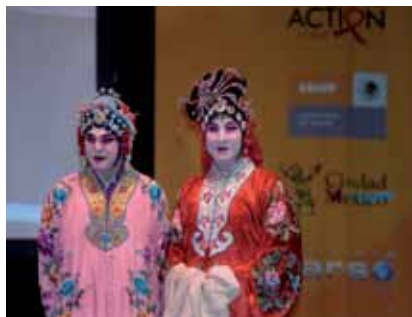
Chinesische Performance bei der Global Village Eröffnungsfeier, AIDS 2008 Mexico/Chinese Show in Global Village Opening, AIDS 2008 Mexico