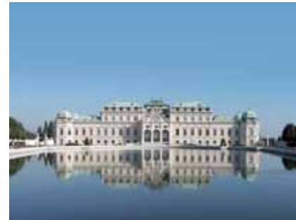
Oberes Belvedere/Upper Belvedere

Reduced admission for conference participants: on all ticket categories € 2 www.belvedere.at