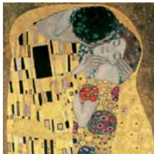
Gustav Klimt, Der Kuss , 1908, (Ausschnitt), Belvedere, Wien/Gustav Klimt, The Kiss , 1908, (Detail), Belvedere, Vienna

Ermäßigter Eintritt für KonferenzteilnehmerInnen: auf alle Ticketkategorien € 2 www.belvedere.at